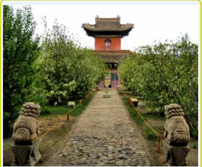
Tempio Chojjin Lama

e il 1908 in onore di un importante Lama chiamato Lubsanhadub, fratello dell'VIII Bodg Khaan. Bellissimo esempio di architettura buddista, al suo interno si trovano delle collezioni di costumi, testi sacri, sculture, dipinti, oggetti artistici e religiosi, tra cui le maschere tsam usate durante le danze sacre.