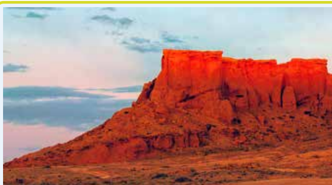
Scogliere fiammegianti di BAYANZAG

Trasferimento nella terra dei dinosauri, nota agli occidentali come le Scogliere Fiammegianti (Bayan Zag), famose per le loro scogliere di arenaria rossa che assumono tonalità rosse e arancioni spettacolari durante il tramonto.